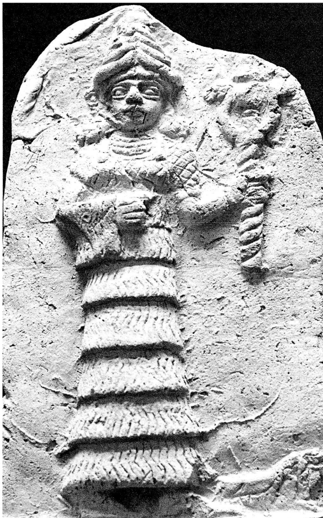
Ishtar, 2e mill. v. Chr.

ming terugdraaien waarin God tegenover de aardse werkelijkheid staat.